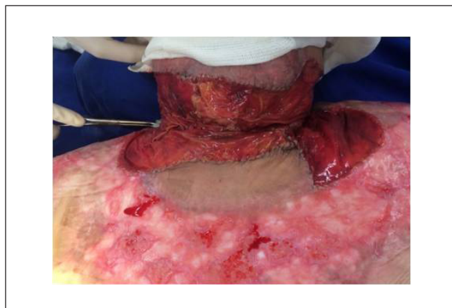
Figura 4 - 4º dia pós-operatório com matriz dérmica.