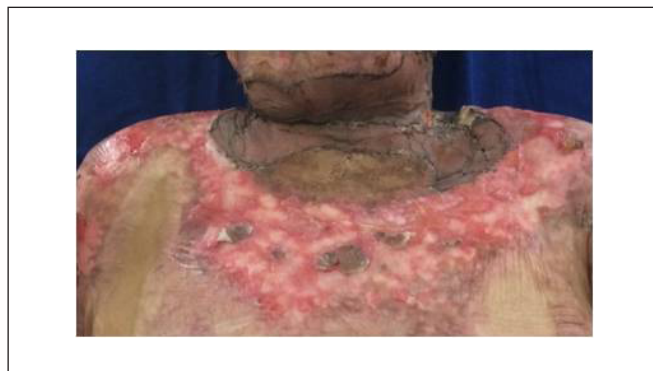
Figura 5 - Enxerto no 15º dia pós-operatório.