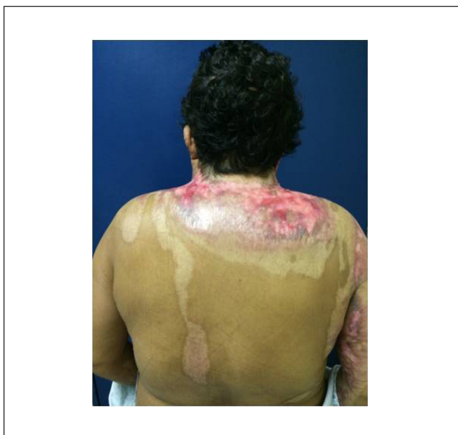
Figura 2 - Vista posterior.

No segundo procedimento cirúrgico, realizado dia 29 de março de 2014, foi implementado enxerto de pele da face anterior da coxa esquerda da paciente na região cervical (Figura 4). Paciente foi avaliada 11 dias após o enxerto (Figura 5). O enxerto e a área doadora apresentavam-se em bom aspecto, com recuperação funcional da amplitude de movimento da região cervical e oclusão total da boca, recebendo alta hospitalar no dia 9 de abril de 2014.